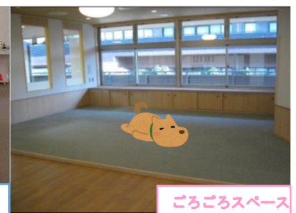
ごろごろスペース