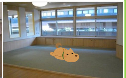
ごろごろスペース