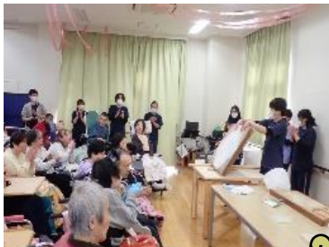
日中活動：そば打ち